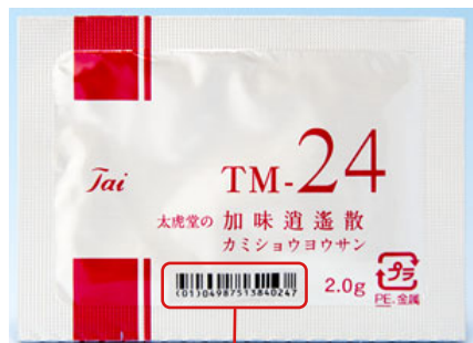
調剤包装単位コード（GS1）